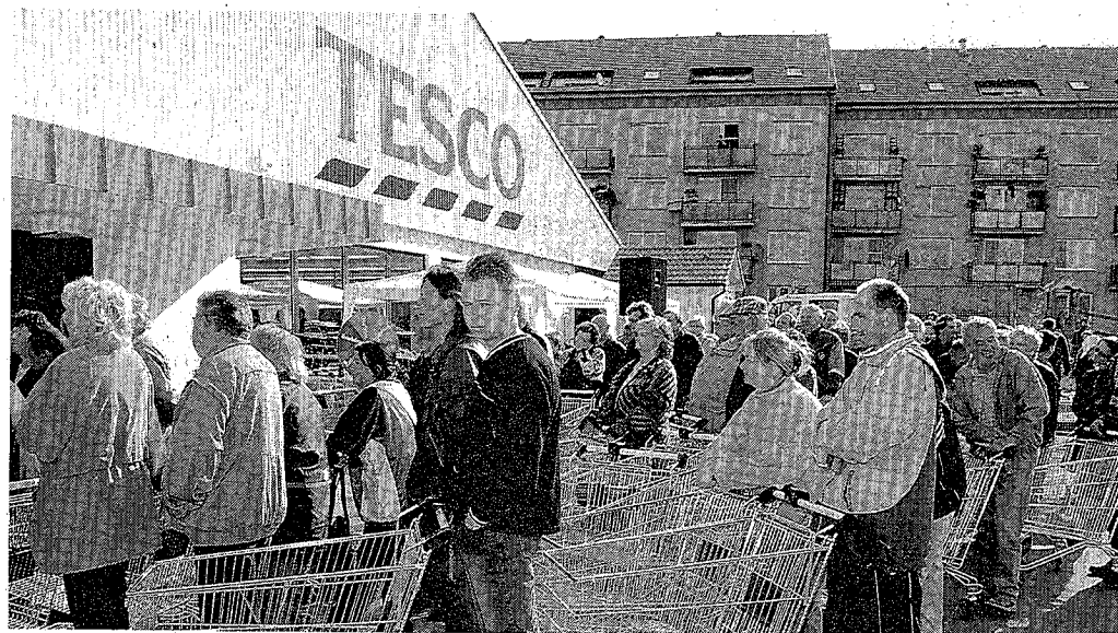
SMĚR MENŠÍ MĚSTA. Tesco otevřelo v červnu v Mikulově svůj první „malý supermarket“. V nejbližších dvou letech budou s expanzí do menších měst pokračovat i další řetězce.

2006: Kaufland Domažlice 2007: obch. galerie Dvořák Plzeň, obch. centrum Plaza Plzeň